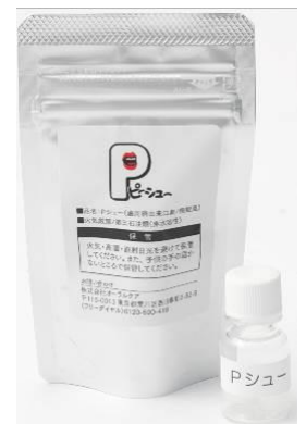
「Pシュー」（価格：880円/税抜）

「Pシュー」の「P」は perio（歯周病）、「シュー」はニオイのことです。つまり“歯周病による口臭”を意味します。気になるのに話題にしにくい口臭の問題。“Pシュー”体験”をきっかけに、「お口のニオイにもっと意識を向けてほしい」、「オーラルケアへの関心をさらに高めてもらいたい」との思いから「Pシュー」は開発されました。