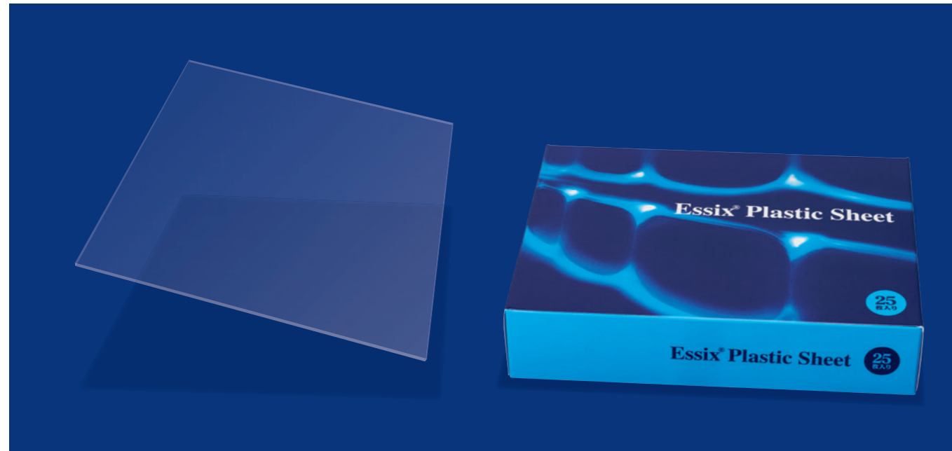
※パッケージは予告なく変更になる場合があります。