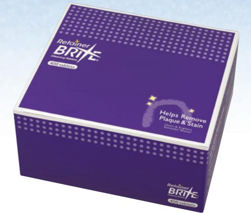
■ リテーナーブライト(標準サイズ)