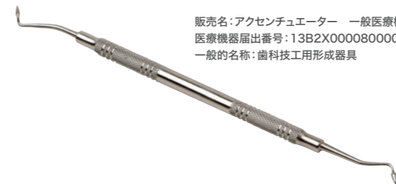
販売名:アクセントエーター 一般医療機器 医療機器届出番号:13B2X00008000033 一般的名称:歯科技工用形成器具

適合性を高めるために、アプライアンスの隣接歯間部にアンダーカットをつける場合に使用します。